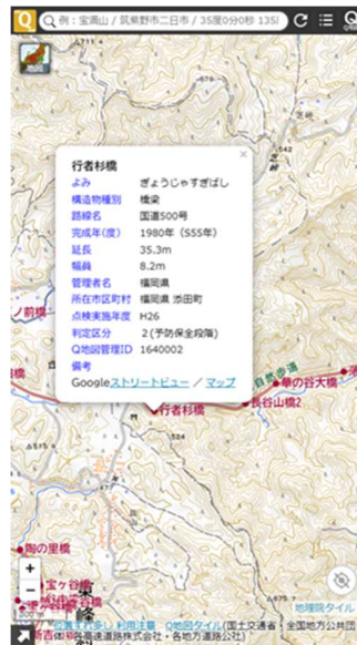
全国道路構造物マップ シリーズ (橋梁)