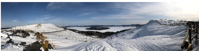
屈斜路湖 360度イメージ画像

次年度から高校で約半世紀ぶりに地理が必修化になり、防災も盛り込まれます。地形を知ることによって防災の意識も小さいころから身に付きます。