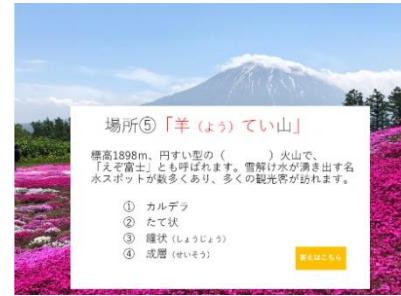
クイズ画面イメージ画像

「VR ナゾトキ地形」は、スマートフォンと簡易ゴーグルを使って 360度で地形を楽しめる 製品です。QRコードをスマートフォンで読み込むだけで、日本の特徴的な地形を立体的に見ることができます。また、地理のクイズに答えながら楽しく知識を深められます。