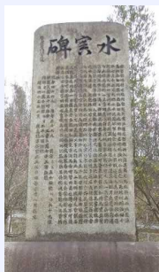
自然災害伝承碑 (広島県坂町小屋浦地区)